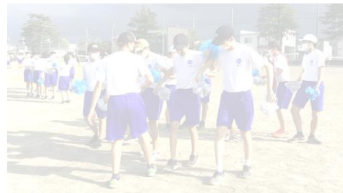
応援パフォーマンス