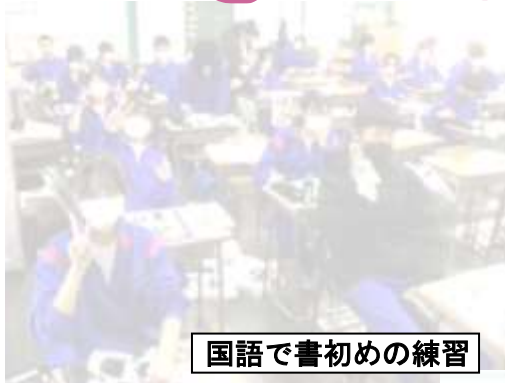
国語で書初めの練習