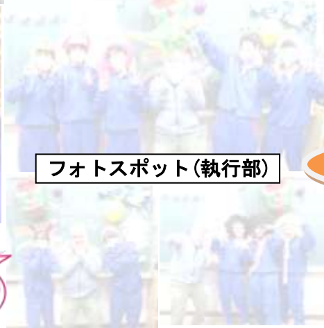
フォトスポット(執行部)