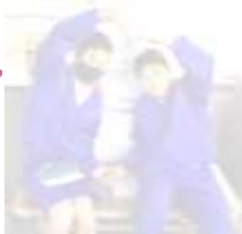
カードバトル (城西向上委員会)