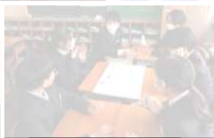
学活：すごろくトーク