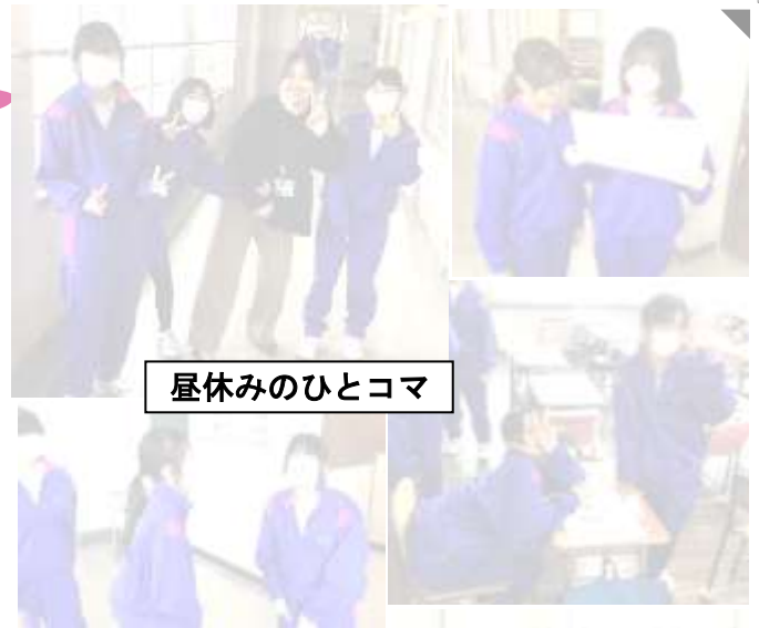
昼休みのひとコマ