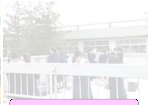
屋上でまったり 気持ちよさそう