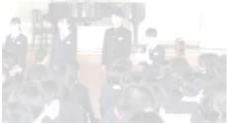
生徒会入会式 リーダーのみんな素敵でした