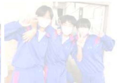
授業も頑張ってるよ！